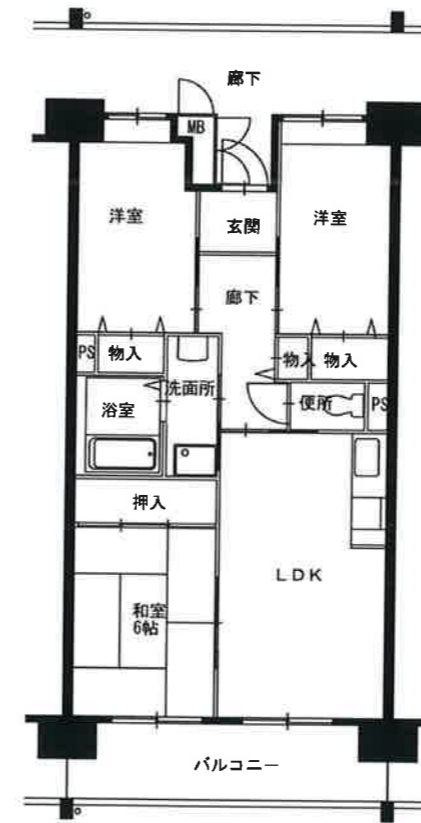
● 3LDK : 64m 2