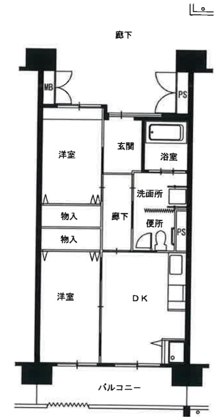
● 車イス2DK : 50m 2