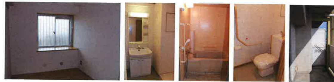
洋室 洗面所 浴室 便所 バルコニー