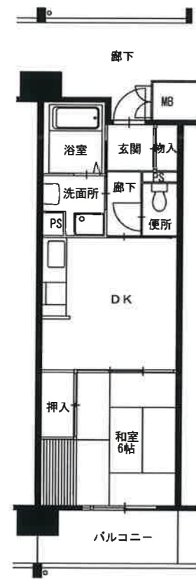
● 1DK : 39m 2