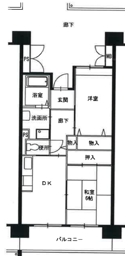
● 2DK : 49m 2