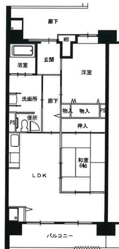
● 車イス2LDK : 65m 2