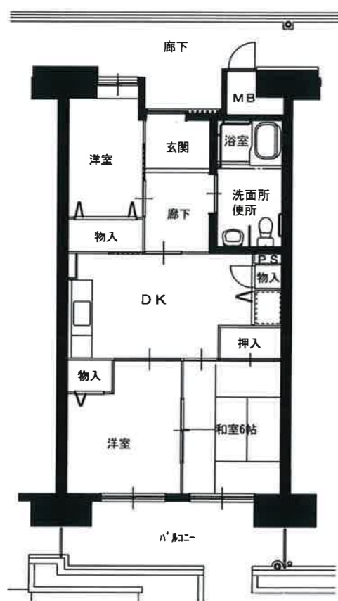
● 車イス3DK : 64㎡