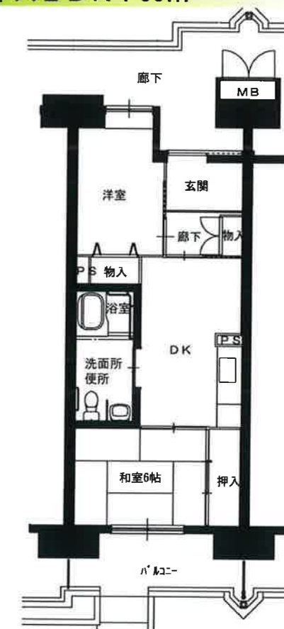
● 車イス2DK : 50㎡