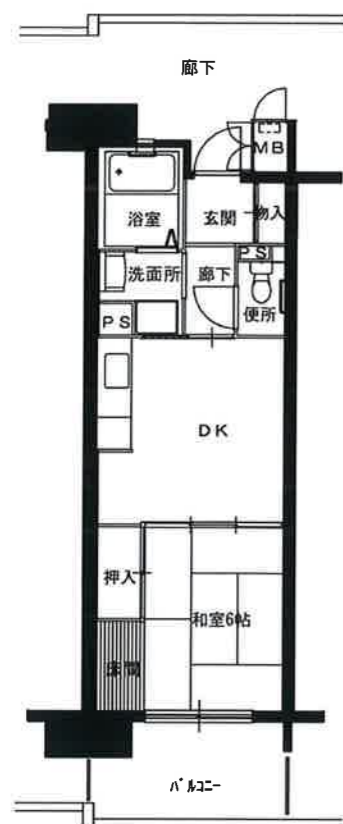
● 1DK : 40㎡