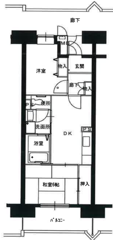
● 2DK : 50㎡