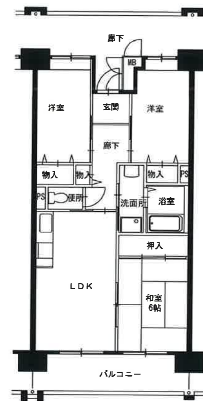
● 3LDK : 64㎡