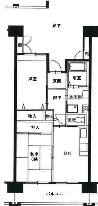
● 2DK : 49㎡