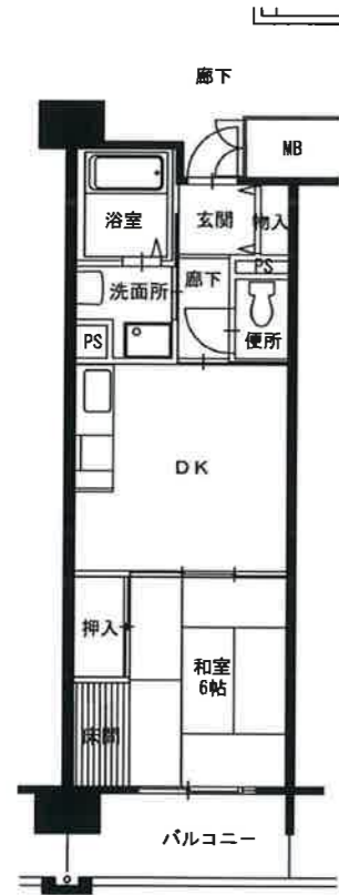
● 1DK : 39㎡