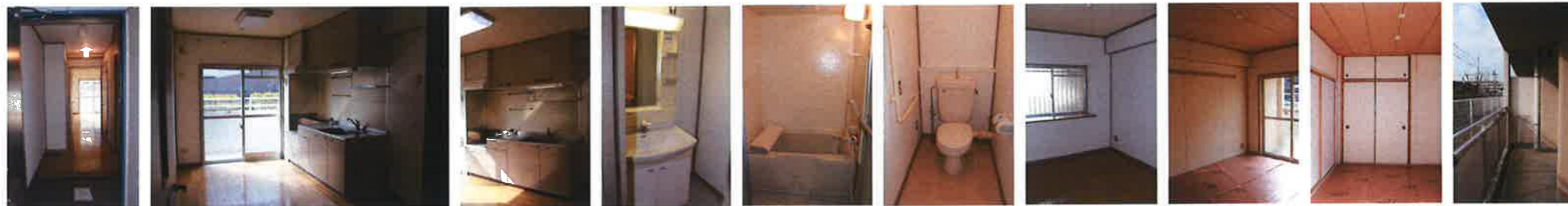
玄関～廊下 DK 流し台回り 洗面所 浴室 便所 洋室 和室 和室 バルコニー