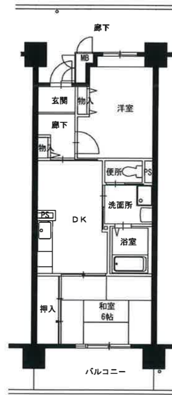
● 2DK : 49m 2