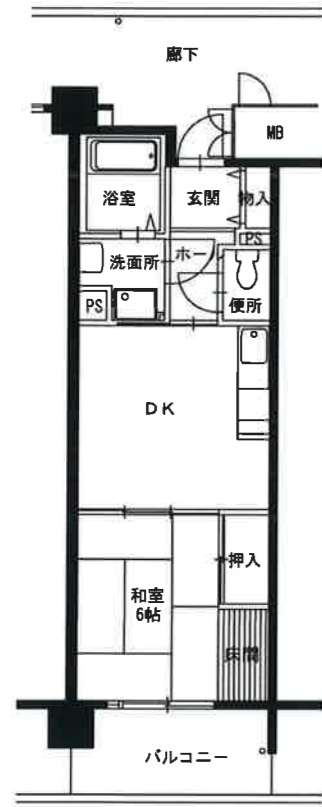
● 1DK : 40m 2