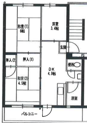
● 10号棟 3DK : 45㎡