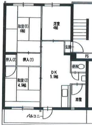
● 9, 11, 12号棟 3DK : 45㎡