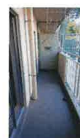
バルコニー (耐震バーなし)