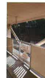
バルコニー (耐震バーあり)