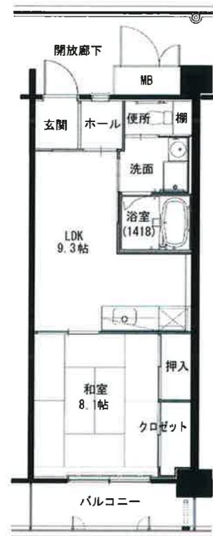
● 1LDK : 43㎡