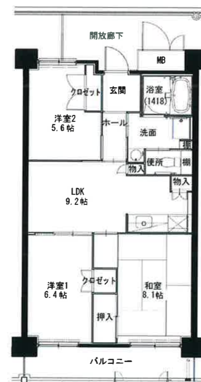
● 3LDK : 64㎡