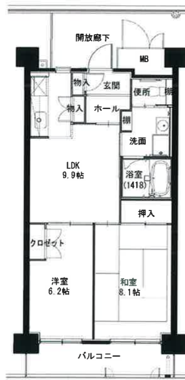
● 2LDK : 55㎡