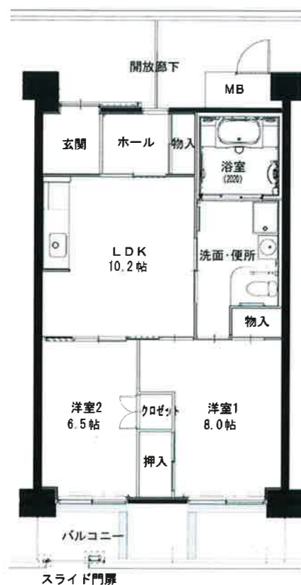
● 車イス2LDK : 62㎡