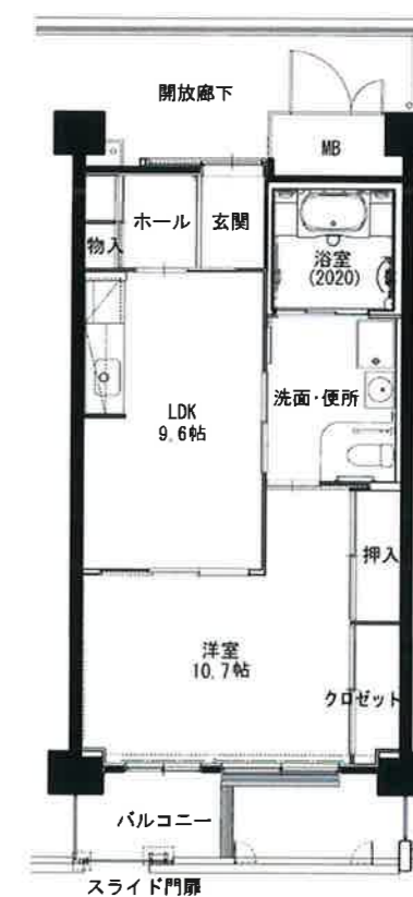
● 車イス1LDK : 54㎡